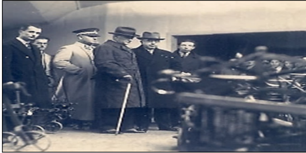
Mustafa Kemal Atatürk, Ziraat Teknik Sergisi'nde 88 .

Birinci Türkiye Ziraat Kongresi ile ilişkili olarak Ziraat Teknik Sergisi 5 Ocak 1931'de Başvekil İsmet (İnönü) Bey tarafından açılmıştır. 86 Mustafa Kemal Atatürk sergiyi 7 Ocak 1931'de gezmiştir 87 .