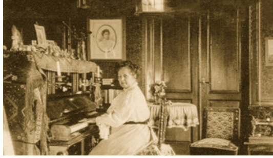
Fotograf 1: Leyla Saz

1894 yılında, II. Kaiser Wilhelm tarafından Alman İmparatorluğu Müzik Yöneticisi olarak atandığına dair bilgiler bulunan Lange, 1895'te "Barbaros Hayreddin Marşı"nı yazdı ve basıldı. 1898'de İstanbul'u ziyaret eden kayser O'nun Bahriye emrinde görevlendirilmesine yönelik olarak Sultan II. Abdülhamid'e tavsiyede bulundu ve bu sayede Ertuğrul Orkestrası'nın şefliği görevine getirildi. Ertuğrul'un İzmir'de sunduğu repertuarda bu eserin olma ihtimali çok yüksektir.