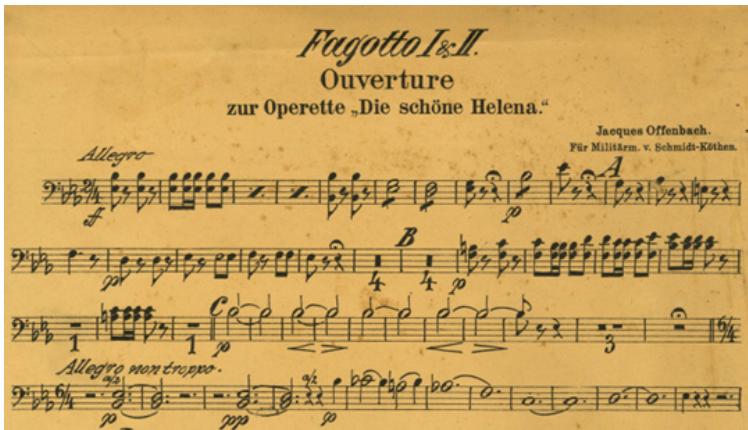
Şekil 3: Jacques Offenbach'ın "Güzel Helen Üvertürü" eserinin Fagot partisinden bir kesit