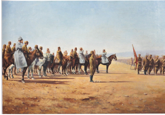
Nazmi Çekli Çal'da büyük resmigeçit. 7 Tuval üzerine yağlı boya 80x120 1959, Tereke Cumhurbaşkanlığı Sanat