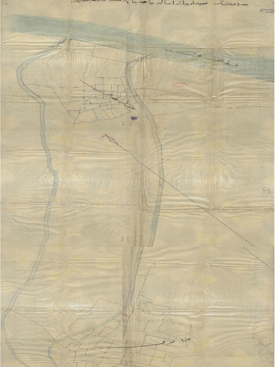
Ek 4: 19. yüzyılda Basra ve Aşar kasabalarını gösterir harita