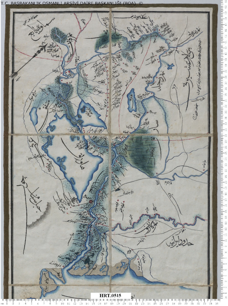
Ek 2: 19. yüzyılın ikinci yarısında Basra şehri etrafındaki bataklıkları gösterir harita.