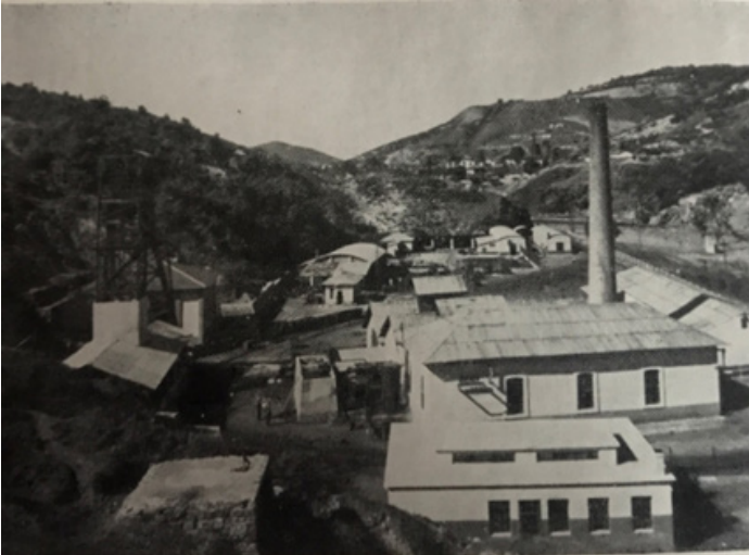
Ek 2: Kömür madeni - Zonguldak. (Михајловић, age. , sayfasız)