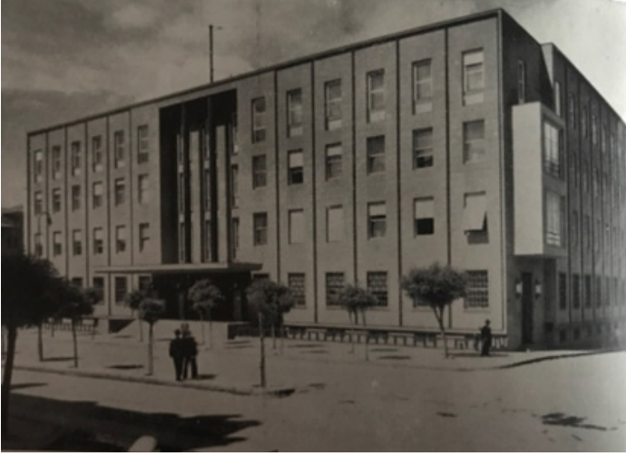
Ek 1: TC Merkez Bankası - Ankara. (Михајловић, age. , sayfasız)