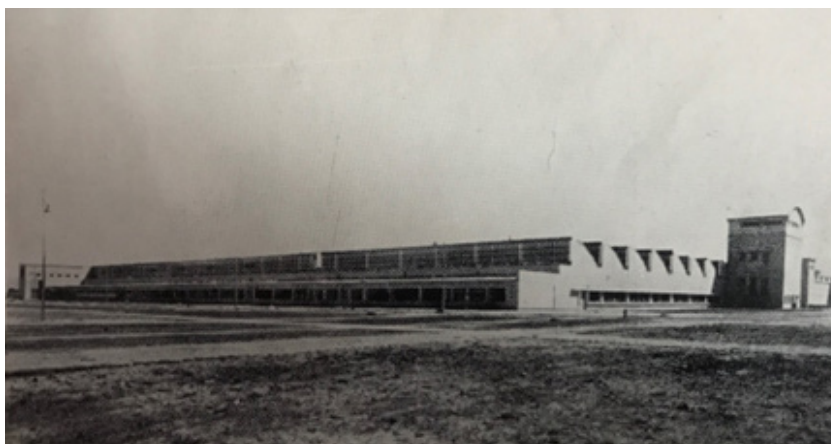
Ek. 4: Tekstil fabrikası- Kayseri (Михајловић, age. , sayfasız)