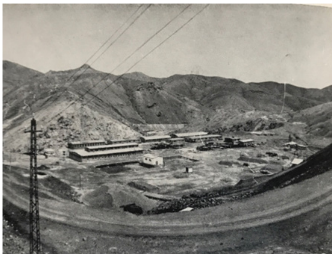
Ek. 3: Bakır madeni – Ergani. (Михајловић, age. , sayfasız)