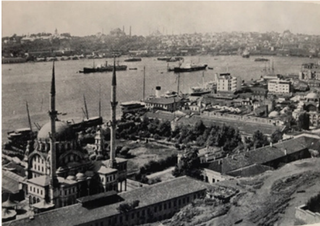
Ek. 6: Liman manzarası – İstanbul (Михајловић, age. , sayfasız)