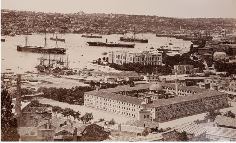
British Library (BL), Visual Arts, Sultan Abdul Hamid II Collection, Volume 45, s. 7 (Divânthane ve Kasımpaşa).