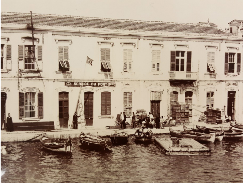
BL, Visual Arts, Sultan Abdul Hamid II Collection, Volume 27, s. 16 (İzmir Liman Ofisi)