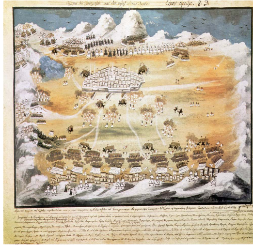
Resim 1: Rum isyancılar ile Avrupalı gönüllülerin Tripoliçe şehrini kuşatma esnasındaki pozisyonlarını gösteren gravür.

Bu şartlarda Tripoliçe şehrinde dış dünya ile ilişkileri kesilen Türkler ve Yahudiler, tarihin en büyük katliamlarından birinin eşiğine gelmiş durumdaydılar. Şehir, çok sayıda Rum isyancı ve yağmaya gelenler tarafından tamamen kuşatılmış durumdaydı. Rumlarla beraber Avrupa ordularında general düzeyinde görev yapmış ve etkili cephaneye sahip gönüllü askerler kuşatmaya destek vermekteydi. İsyancıların etkili menzile sahip top ve havanları bulunuyordu 34 .